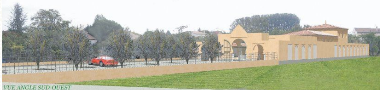
VUE ANGLE SUD-OUEST

Conception B.E.T. Maurice Meunier Maurice Meunier - Maître d'œuvre Léopold ORIGHONI - Maître d'œuvre agréé 13259 Saint-Chamas